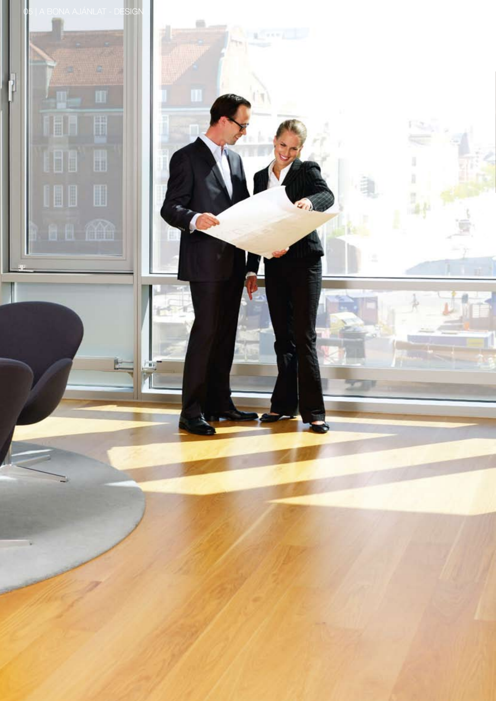
Magánlakás, Auderghem, Belgium