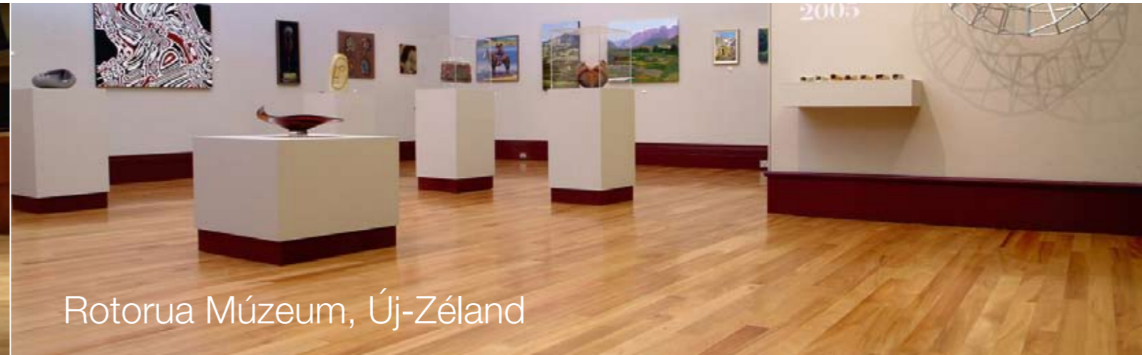
Rotorua Múzeum, Új-Zéland